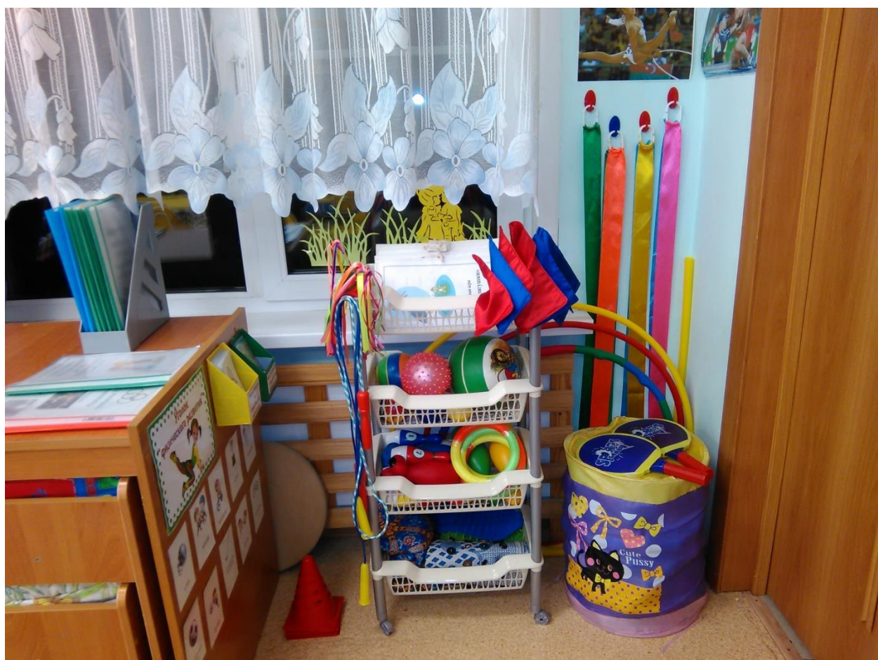
Центр двигательной активности.