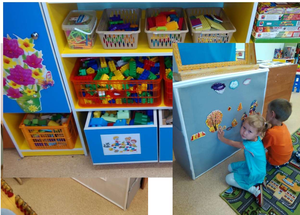
Центр театральной деятельности

6. Безопасность – обеспечиваю соответствие всех элементов предметно-пространственной среды требованиям надежности и безопасности их использования и требованиям СанПиН.