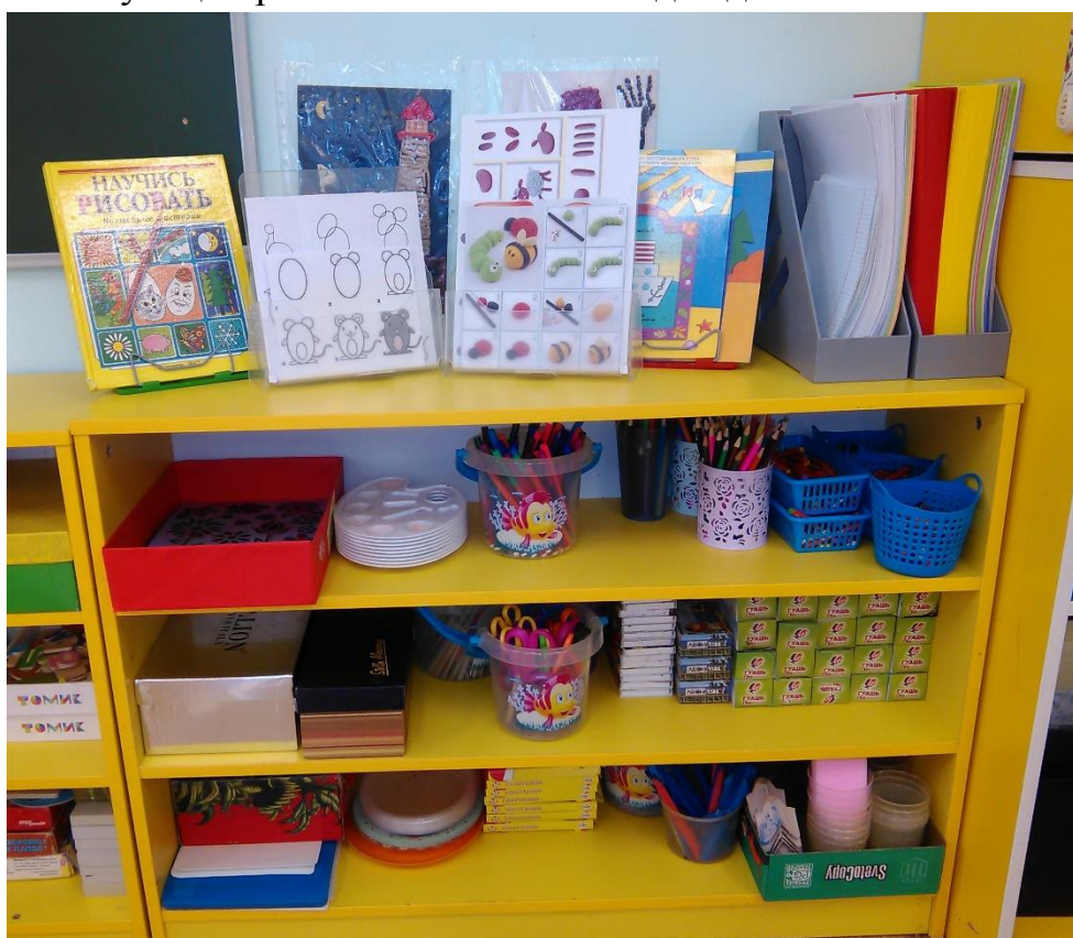
Центр художественного творчества.

5. Доступность – для всех воспитанников обеспечиваю свободный доступ детей к играм, игрушкам, материалам, пособиям, оборудованию, способствующих развитию основных видов деятельности