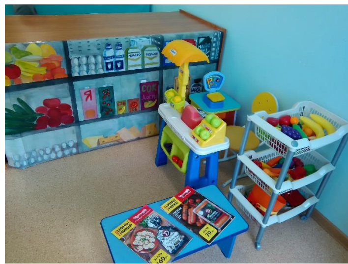
Центр сюжетно-ролевой игры.

3. Полифункциональность — сочетание нескольких функций в одном предмете дает возможность разнообразного использования различных составляющих предметной среды (мебели, модулей, ширм и т.д.).