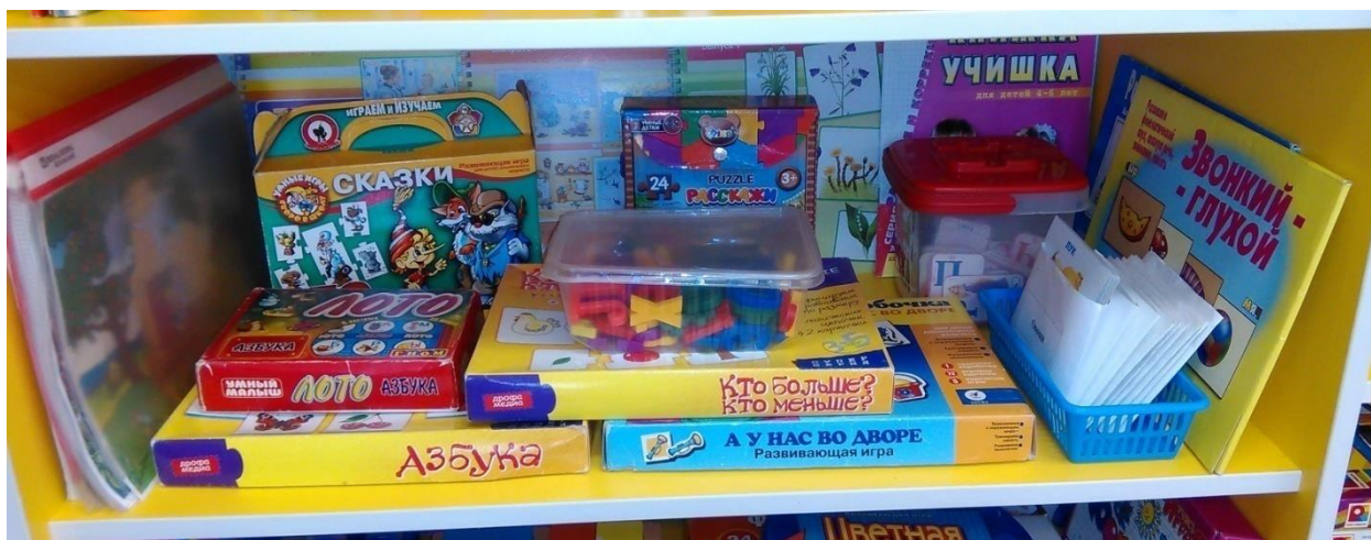
Центр речевого развития.