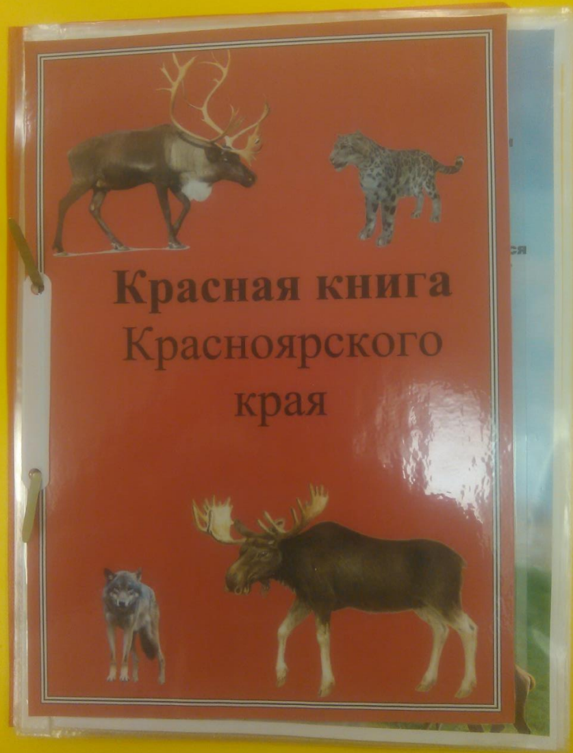
Оформление Красной книги Красноярского края.