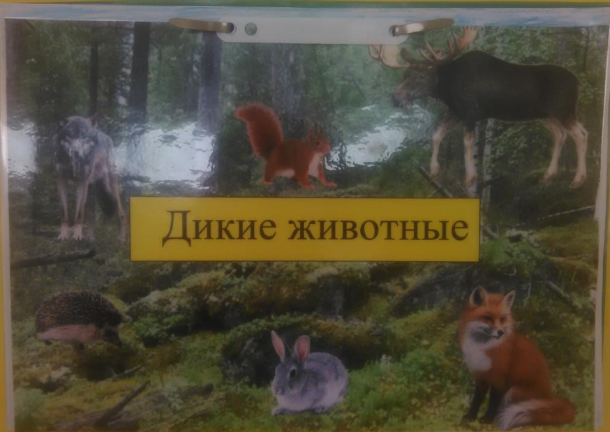
Оформление альбома «Дикие животные»